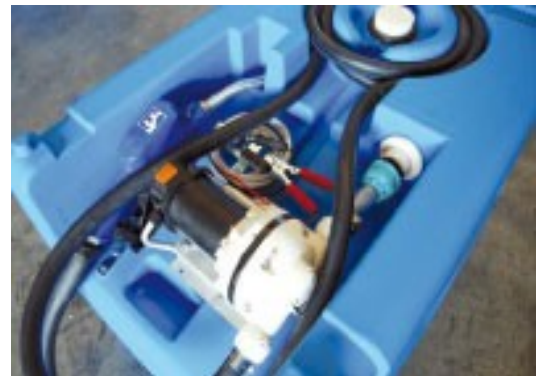
Pumpeneinheit mit Automatik-Zapfpistole