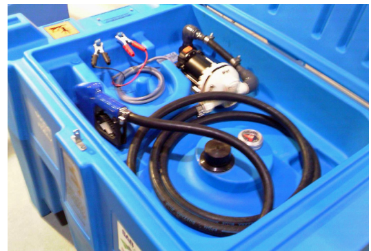
Pumpeneinheit mit Automatik-Zapfpistole